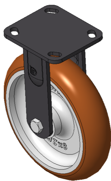
圖片可能與原始產品有所落差