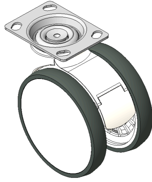
圖片可能與原始產品有所落差