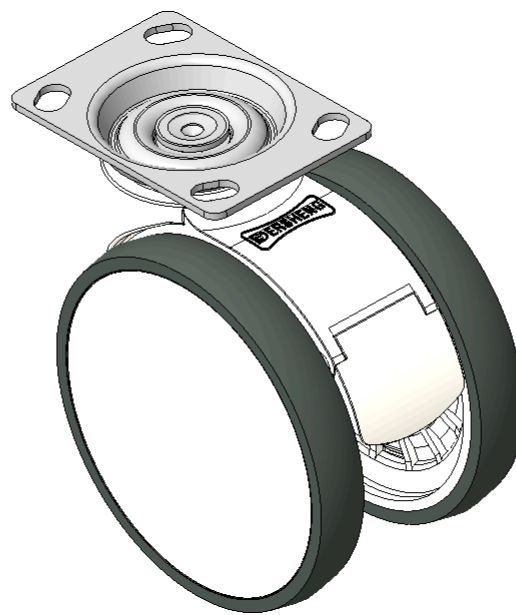
图片可能与原始产品有所落差