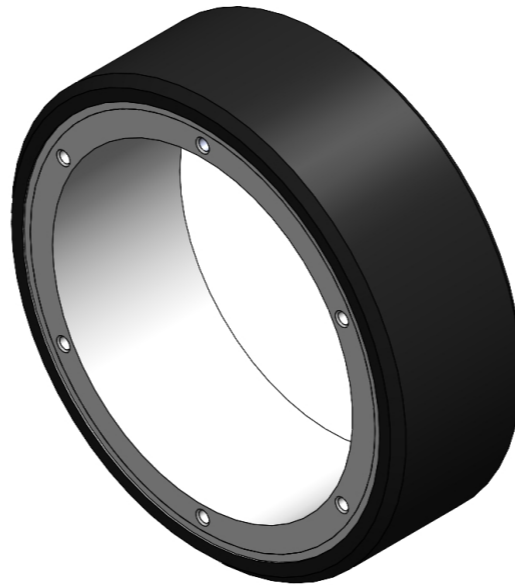
Hình ảnh có thể khác với sản phẩm gốc

Gia công ngoài: Polyurethane chất lượng cao