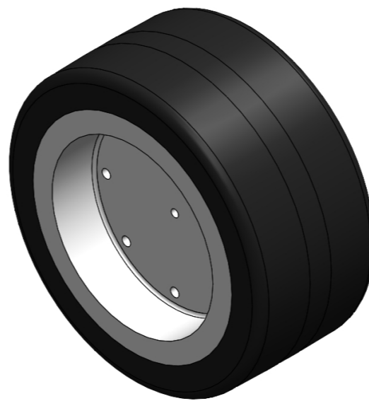
Hình ảnh có thể khác với sản phẩm gốc